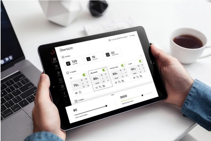
[Zdjęcie: TRILUX_LiveLink One App]

Prawdziwe zarządzanie oświetleniem typu Plug and Play - aplikacja LiveLink ONE automatycznie rozpoznaje oprawy podłączone do sieci i natychmiast zapewnia funkcjonalną podstawową konfigurację.